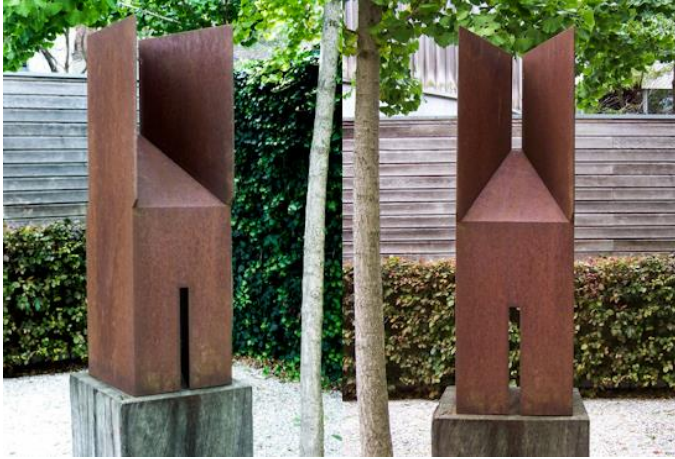
Over het beeld – Embrasure ( cortenstaal 100 x 29 x 33 cm) Jaar 1999-2000

“Architectonische vormen zoals verdedigingswerken hebben mij vanwege de bijna abstracte kwaliteit altijd al gefascineerd. Veel van mijn beelden zijn vanaf 1999 geconcipeerd rond een schacht, vizier, poort of trap. Deze motieven heb ik echter zodanig uitvergroot, dat een minimaal volume of massa nodig zijn om deze als beeld gestalte te geven. Het motief wordt als het ware zelf beeld...”